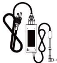
③ AC 變壓器 (AC100 ~ 240V · 50/60Hz)