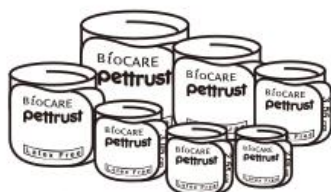
② Pettrust 脈壓帶 7種尺寸