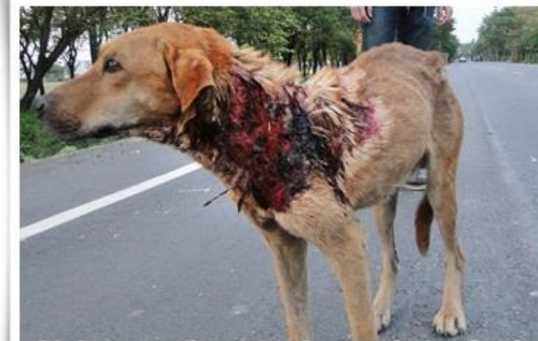
救援時看不出來面積有多廣