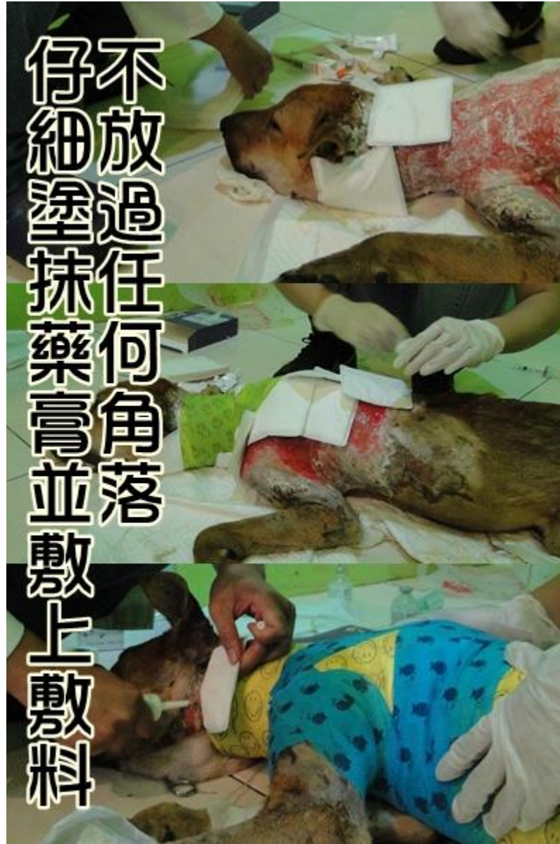
不 放 過 任 何 角 落 仔 細 塗 抹 藥 膏 並 敷 上 敷 料