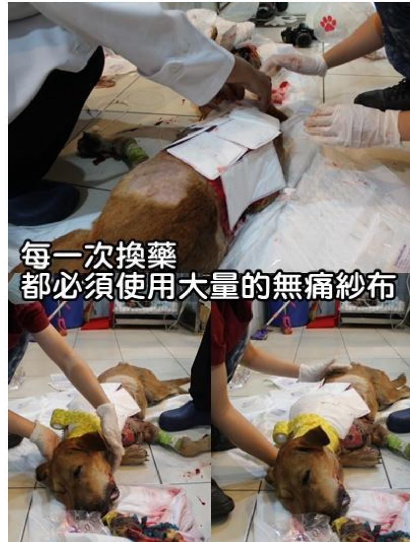
每一次換藥 都必須使用大量的無痛紗布