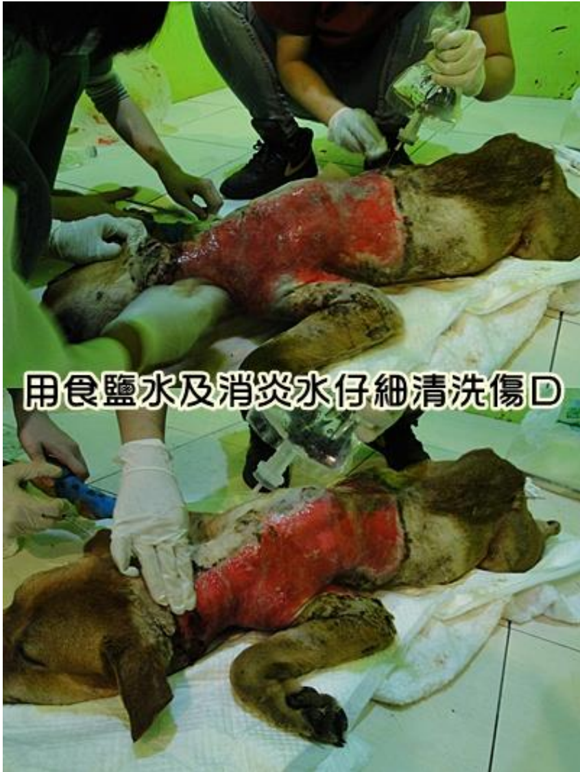
用食鹽水及消炎水仔細清洗傷口